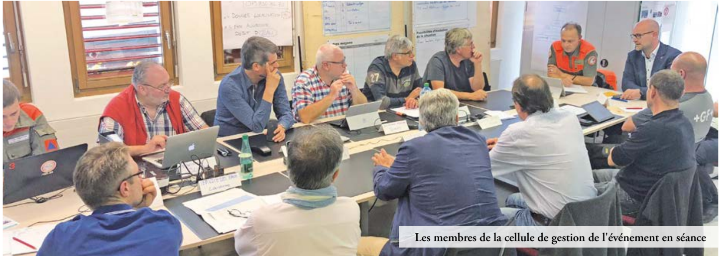
Les membres de la cellule de gestion de l'événement en séance